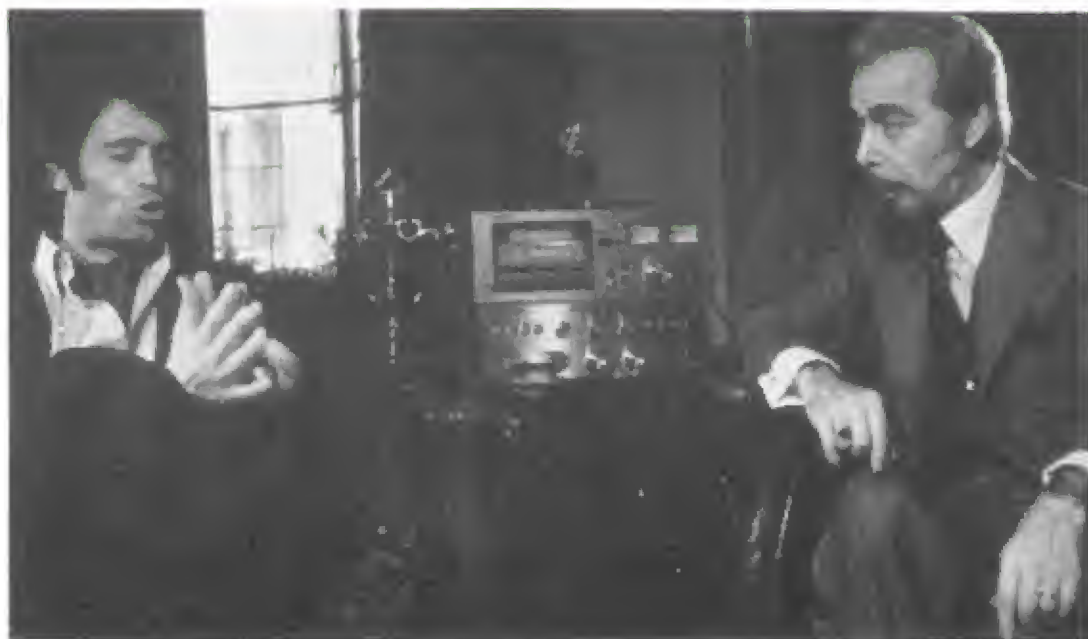
Ramiro Oliveros - Narciso Ibáñez Menta